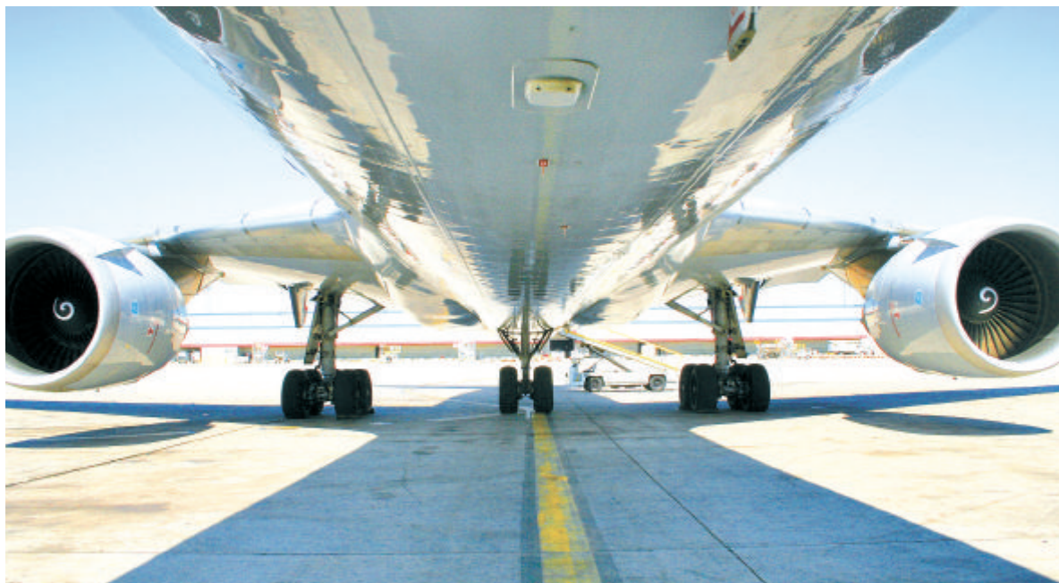
Reisekostenzuschüsse des Wissenschaftsministeriums ermöglichen Wissenschaftlern, mit internationalen Kollegen gemeinsame Experiment- und Laborarbeit zu betreiben.