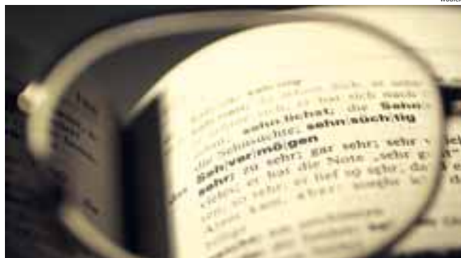
Kein Wörterbuch nötig: Neues Service hilft Gründern

Der Clou: Sie müssen sich nicht mit den handelsüblichen Akronymen abgeben. „Die technischen Begrifflichkeiten sind den kleinen Unterneh-