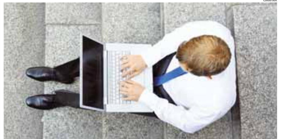
Neue IT-Lösungen ermöglichen mehr Freiheit bei der Gestaltung des Arbeitsplatzes – das senkt die Kosten und erhöht die Produktivität der Mitarbeiter