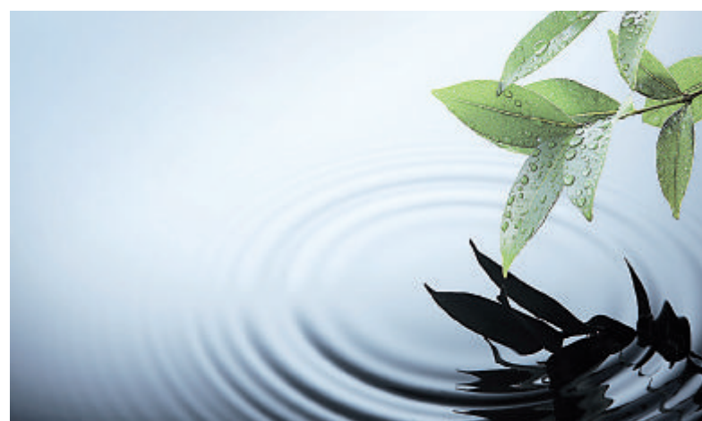
Alle großen Zukunftsfragen der Menschheit hängen davon ab, wie sorgsam wir mit unserem Wasser umgehen.

Das Bundesministerium für Wissenschaften und Forschung (BMWF) führt daher bereits seit dem Jahr 2006 in Kooperation mit verschiedenen Forschungsinstitutionen die Workshop-Serie