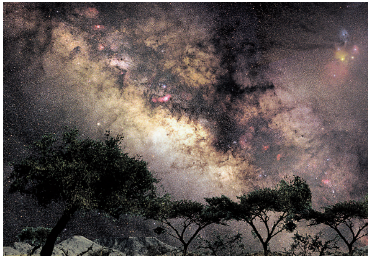
Das Jahr 2009 steht ganz im Zeichen der Astronomie. Zahlreiche Veranstaltungen sollen den Menschen die Welt über unseren Köpfen näherbringen.