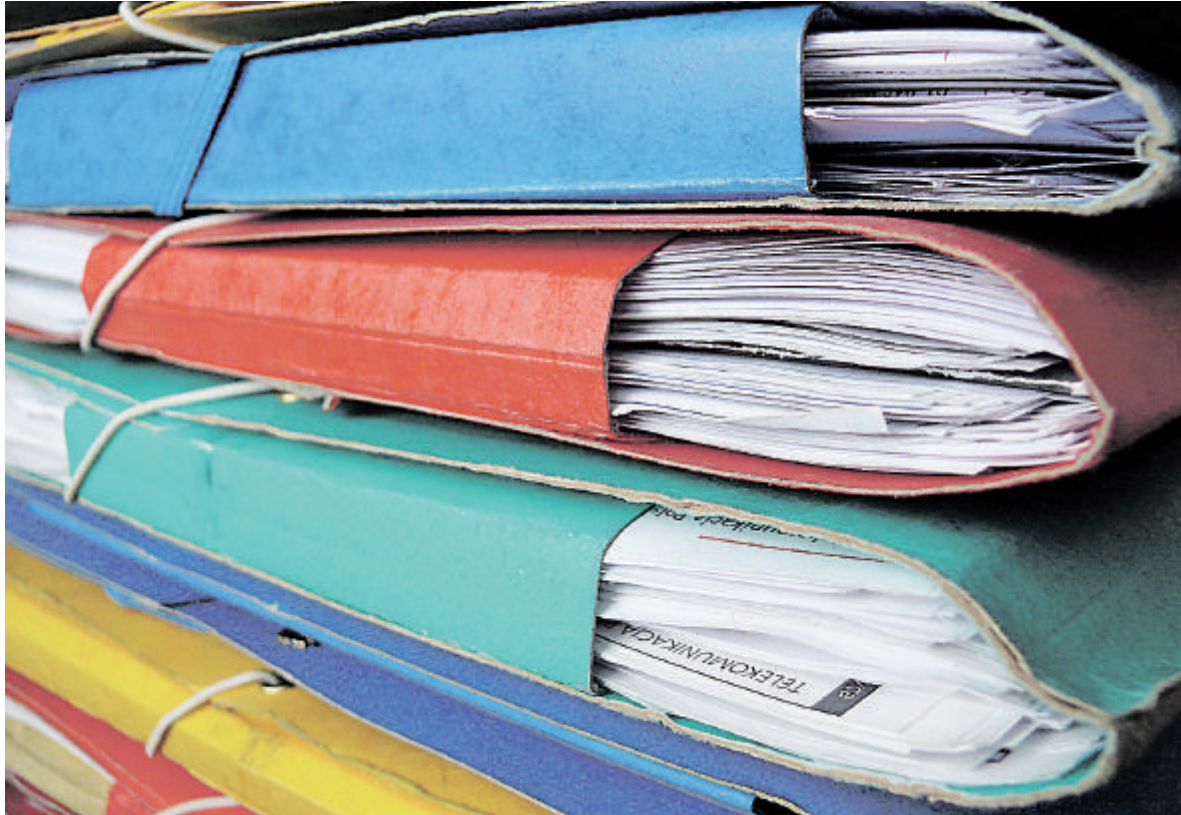
Ein automatisiertes Dokumenten-Management-System würde den täglichen Workflow optimieren und den Mitarbeitern alle relevanten Geschäftsdaten auf Knopfdruck zugänglich machen.

In klug strukturierten Enterprise-Content-Management (ECM)-Systemen sieht Kolleth daher einen klaren Wettbe-