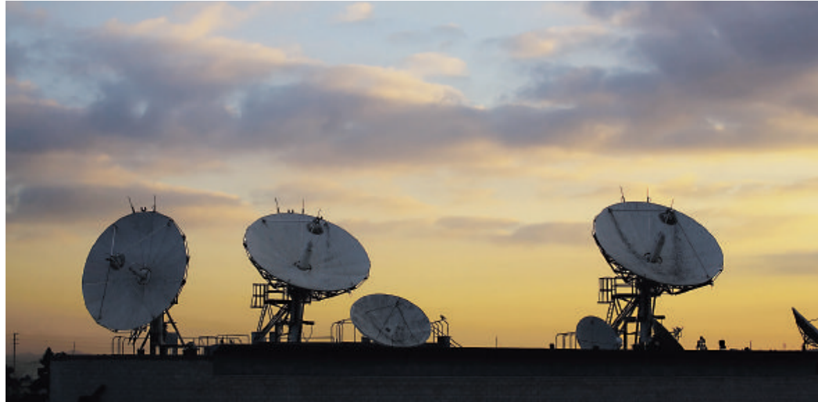
Für Telekom Austria stehen 2009 der weitere Umbau des Netzes zu einer universellen All-IP-Infrastruktur und die Verbindung von Festnetz und Mobilfunk im Mittelpunkt.

Eine intensiv diskutierte Technologie ist die IT-Virtualisierung, bei der IT-Ressourcen statt wie bisher physisch nun virtuell abgebildet werden. Damit können auch leistungshungrige Applikationen weniger beanspruchte Systeme nutzen, bessere Auslastungsgrade werden erreicht. Eine solche Virtualisierung kann sich Goldenits vornehmlich in den Bereichen Storage und Server vorstellen, aber auch bei Netzwerken und Clients ist sie denkbar.