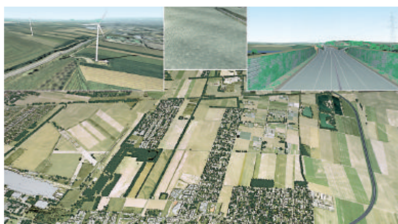
Der Computer informiert die Einsatzzentrale bereits im Vorfeld über die realen Gegebenheiten vor Ort.

Die von VRVis entwickelte Software „VEI-3D“ ist in der Lage, derartige potenzielle Einsatzorte detailgetreu zu visualisieren – also alle sichtbaren, aber auch unsichtbaren Gegebenheiten (Kanäle, Leitungen, andere Verkehrswege, Bevölkerungsdichte et cetera) auf dem Bildschirm zu zeigen.