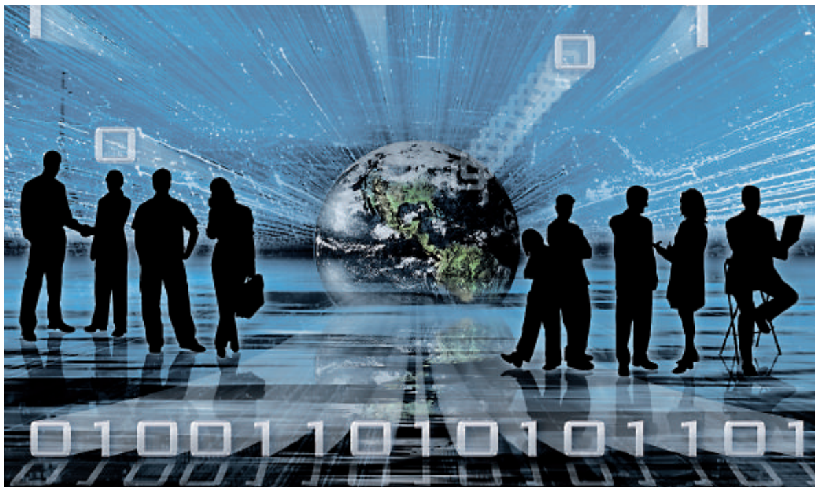
Die flauere Wirtschaftslage verändert die Prioritäten, die Unternehmen in Sachen IT setzen. Gefragt sind nunmehr Controlling und Reporting sowie strenges Kosten-Management.