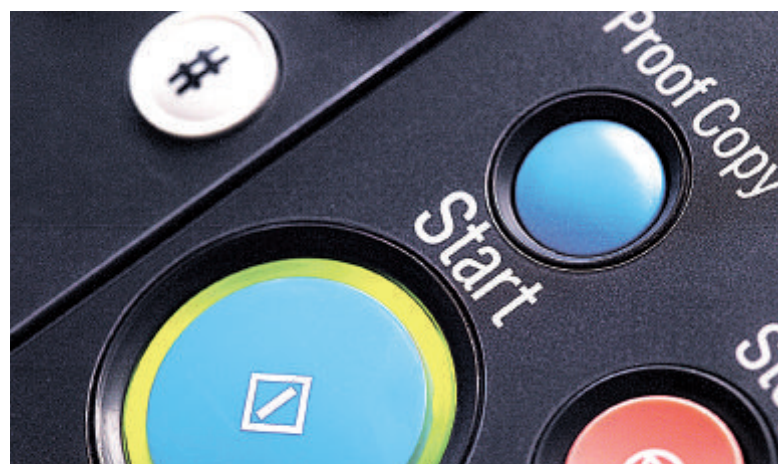
Die Optimierung des Druck-Outputs kann vielen Unternehmen noch enorme Einsparungen erschließen.

Aus Sicht von Konica Minolta wird es verstärkt darum gehen, wie Unternehmen rund um ihre Dokumente professioneller agieren – also ihre Dokumente optimal drucken, scannen, verwalten, ablegen, wiederfinden und archivieren. Hier sieht Bischof enormes Potenzial: „Bislang werden in einer durchschnittlichen Büroabteilung 50 bis 80 Prozent der Arbeitszeit für Informationsbeschaffung aufgewendet. Ein heimischer