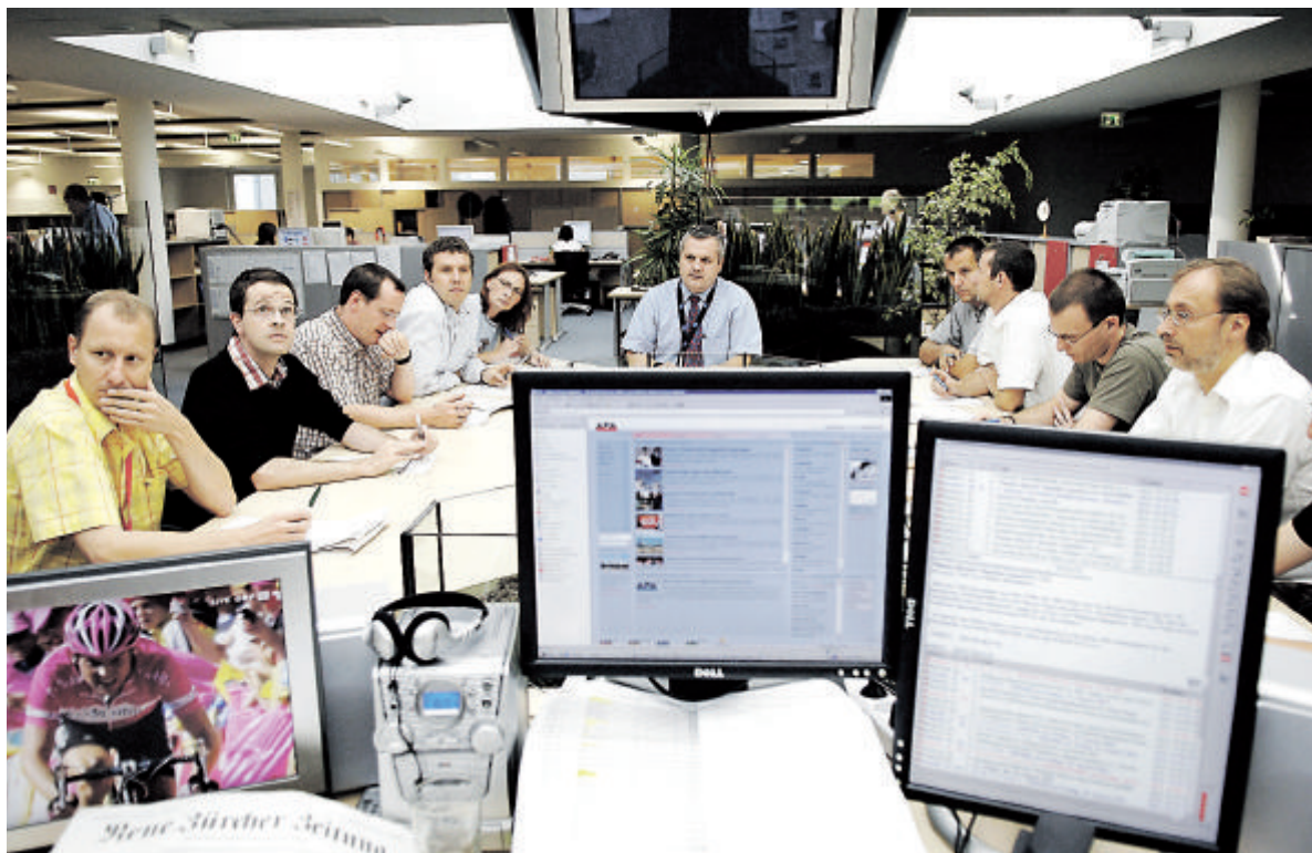
Als zeitgemäße Antwort auf die sich rasch ändernden Kundenbedürfnisse ist die APA gerade dabei, ihre gesamte Redaktion auf ein einziges multimediales Redaktionssystem umzustellen.