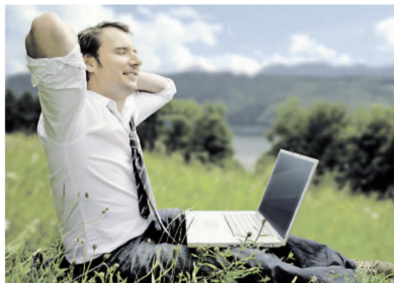
Energieeffizienz – Stichwort „Green IT“ – wird 2009 eine entscheidende Rolle in der IT-Branche spielen.

gumentiert wird damit, dass man künftig verstärkt mit mobilen Geräten im Netz aktiv sein wird. Das bedeutet, dass das Keyboard schon alleine aus praktischen Überlegungen nicht mehr die Hauptschnittstelle sein kann. Andererseits ortet man bei IBM aber auch verstärkt einen Trend in Richtung „soziale“ Software wie Wikis oder Blogs. „Das ist eine Art der Kommunikation, für die man sich Zeit nehmen muss. Und die hat man in der Regel am Abend, daheim vor dem großen Monitor“, so Haschek. www.ibm.at